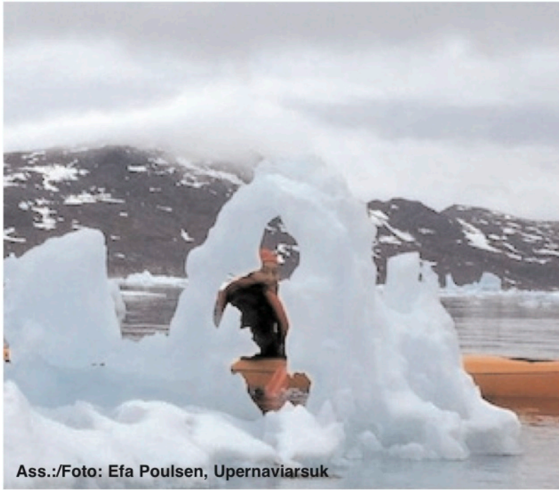
Ass.:/Foto: Efa Poulsen, Upernaviarsuk